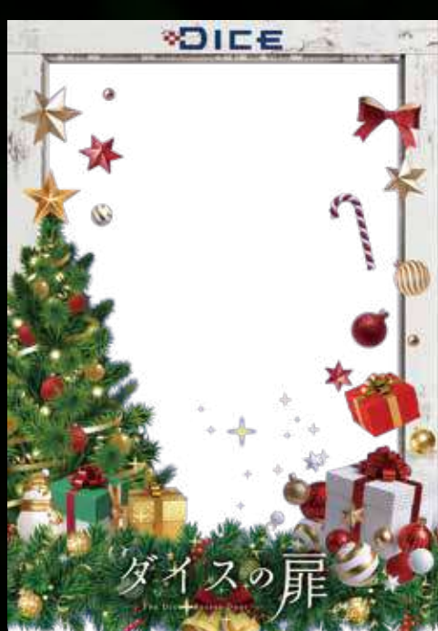
ダイス スペシャル フォトフレーム